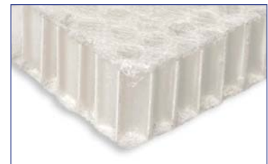
Nido de abeja de polipropilene