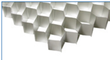
Nido de abeja de aluminio