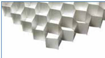
Nido de abeja de aluminio